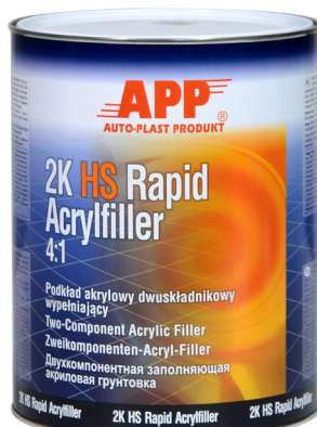
Podkład 4,0 L