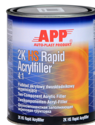
Podkład 1,0 L