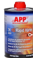
Utwardzacz 1,0 L szybki