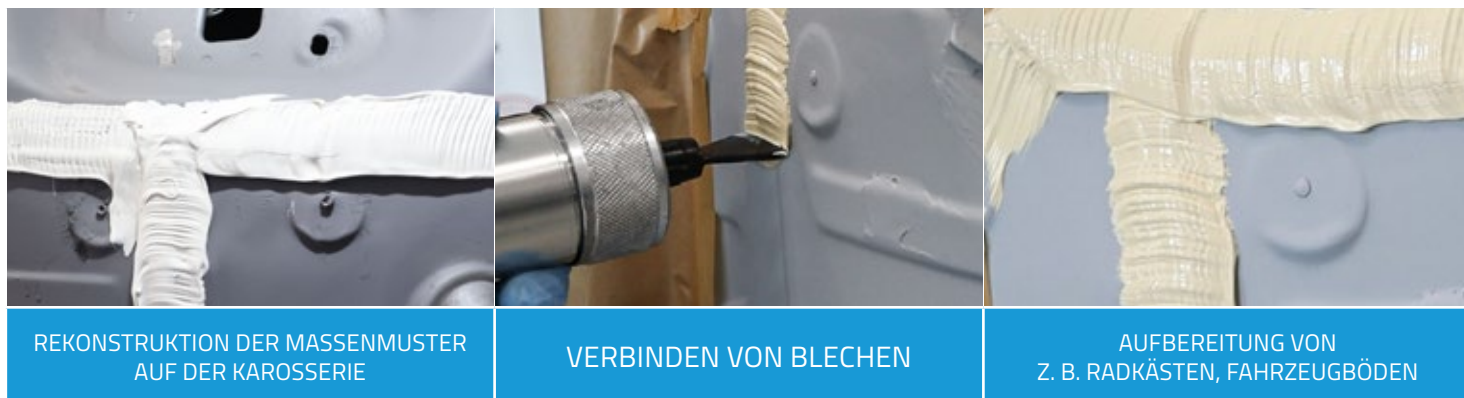
REKONSTRUKTION DER MASSEMUSTER AUF DER KAROSSERIE