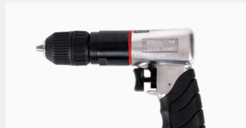
APP-Nr. 139610N NTools PW