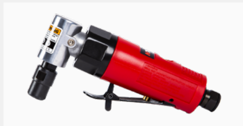
APP-Nr. 139102N NTools PSK 6