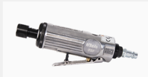
APP-Nr. 139100N NTools PSP