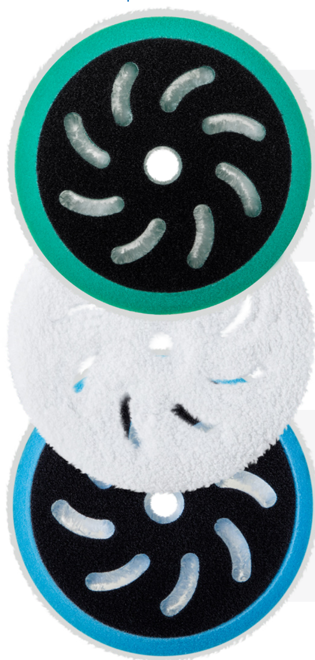
APP QUARTZ Q809 - POLISHING

APP Quartz Q809 und Q810 sind zur Verwendung mit den Polierpasten APP Q801 und APP Q802 der Quartz-Produktlinie bestimmt.