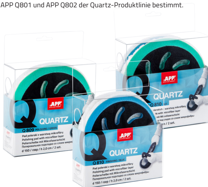
APP QUARTZ Q810 - FINISHING