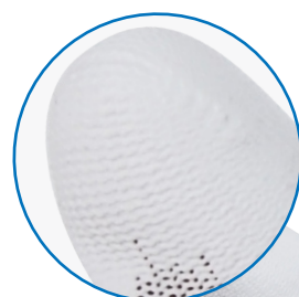
(PU) POLYURETHAN- SCHICHT AN DER GRIFF- FLÄCHE