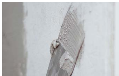
Dans les travaux de construction: plâtrage, masticage