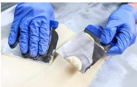
L'application de différents types de masses