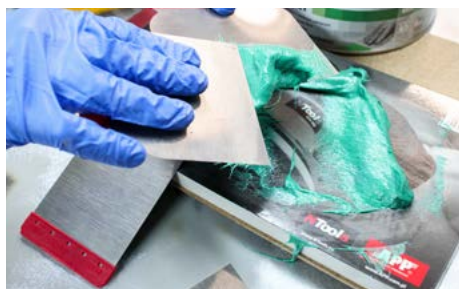
Le mélange du mastic avec le durcisseur