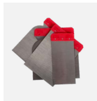
APP n° 250312 - Spatules métalliques en acier