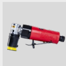
APP Nr 139210N NTools PSM30