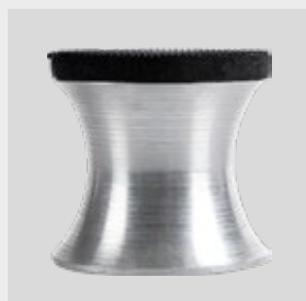
APP Nr 150409 APP KA PSK