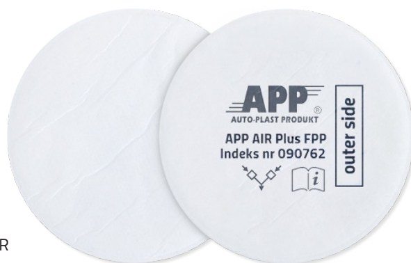
SCHÉMA DE L'ASSEMBLAGE DES FILTRES SUR LA DEMI-MASQUE APP AIR PLUS

En outre, l'offre APP comprend les filtres anti-poussières plats P2 R prévus pour la demi-masque APP AIR Plus (A1+P2 R).