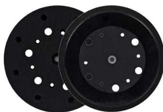
Tarcza robocza d150 RUPES rzep, 14+1 otworów, SOFT - EK-BK-AK-TK Nr APP 60902.154