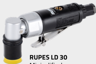
RUPES LD 30 Miniszliferka pneumatyczna (APP nr 131110)