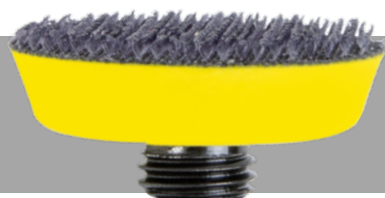
NTools nr 150540N na rzep