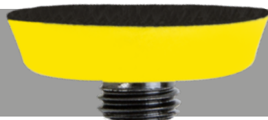
NTools nr 150542 na klej