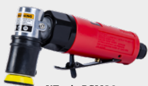
NTools PSM30 Pneumatyczna szliferka wibracyjna do usuwania wtrąceń (APP nr 139210N)