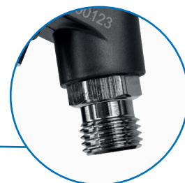
Złącze powietrza z gwintem 1/4"