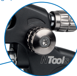
Regulator szerokości strumienia