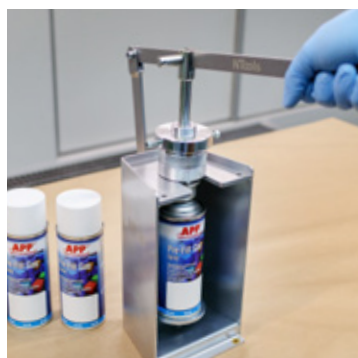
APP nr 210189 Maszyna ręczna do nabijania spray