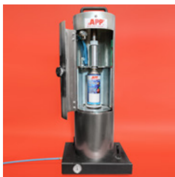
APP nr 210191 Maszyna pneumatyczna do nabijania spray