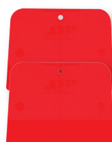
12x11x9 cm 2 szt.