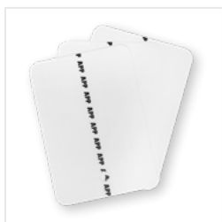
APP Nr 250620 Test karta metalowa