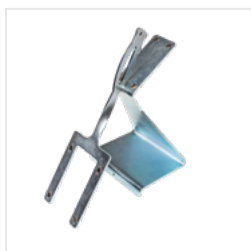
APP Nr 250616