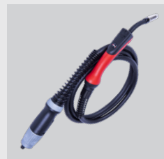
solidny, elastyczny przewód prądowy z przegubami kulowymi o dł. 3 m