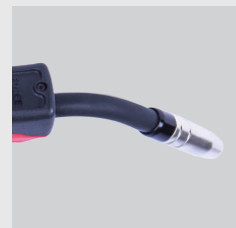
typ palnika MB15