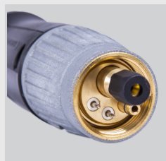
złącze centralne typu EURO

nie spowoduje zmiany położenia „fajki” w rękojeści nawet podczas intensywnego użytkowania. Fajka powleczona jest niklem, który znacząco ogranicza jej zużycie przy częstych zmianach dyszy gazowej. Posiada lepszy system chłodzenia, który powoduje lepszą emisję ciepła, czyli szybsze chłodzenie uchwytu nawet przy wyższych natężeniach prądu spawania.