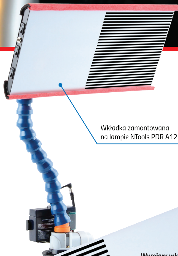
Wkładka zamontowana na lampie NTools PDR A12

Wkładka refleksyjna NTools WR ułatwia interpretację kształtu defektu, umożliwiając podjęcie decyzji o dalszym kierunku niwelowania nierówności.