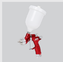
Devilbiss GTI Pro Lite