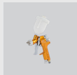
Devilbiss SRI Pro Lite