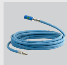
APP AP 1