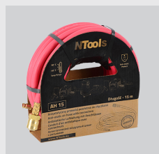
NTools AH 15