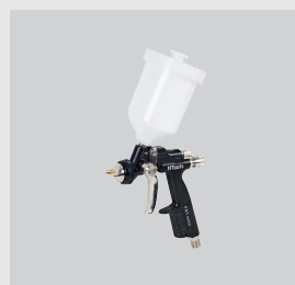
NTools FX1 mini