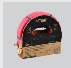
NTools AH 10