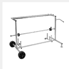
NTools Foil Cart