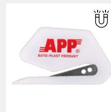
APP M Cut

Тележка для маскировочной пленки 2 в 1, 13 кг, 1560 x 670 x 800 мм