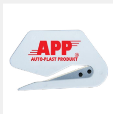
APP F Cut