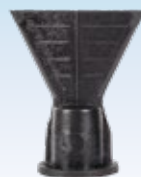
110607 Сопло изготовлено из мягкого пластика.