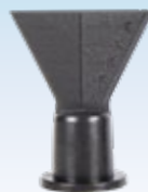
110606 Сопло изготовлено из твердого пластика.