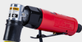
NTools PSM30 Пневматическая шлифовальная машина для малых поверхностей APP № 139210N