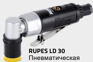
RUPES LD 30 Пневматическая мини-шлифовальная машина APP № 131110