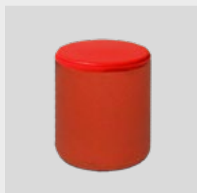
APP Nr 150401