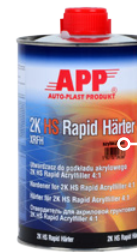
Отвердитель 1,0 л быстрый