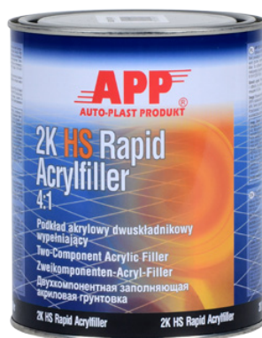
Грунтовка 4,0 л