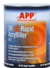
Грунтовка 1,0 л