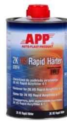
Отвердитель 1,0 л нормальный