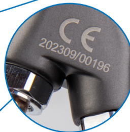
Серийный номер краскопульты