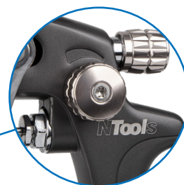
Регулятор ширины струи