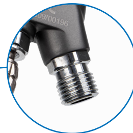
Воздушное соединение с резьбой 1/4"