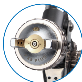
Головка типа MP (LVMP)

Кружка устойчива к химическим веществам, используемым при окраске распылением с применением органических (разбавителей) и водных средств, изготовлена из POM - полиоксиметилена