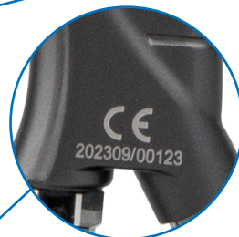
Серийный номер краскопульты