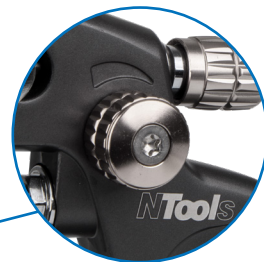
Регулятор ширины струи