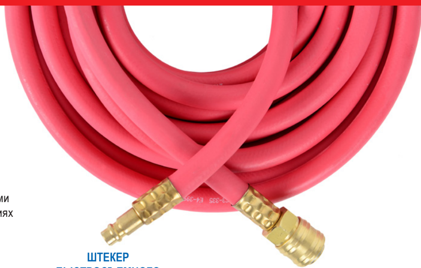
ШТЕКЕР БЫСТРОСЪЕМНОГО СОЕДИНЕНИЯ (APP № 389255)

* не относится к шлангу NTools AH 50 (APP № 389040)